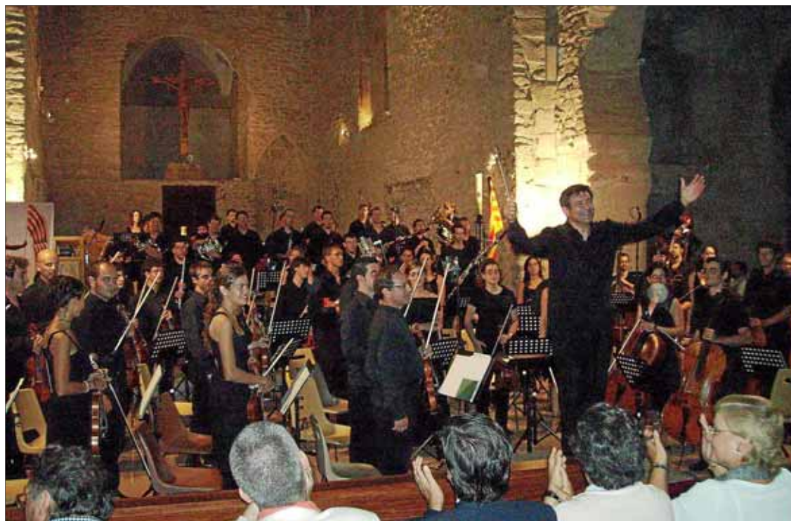
Imagen de archivo de la Ojipc durante un concierto.